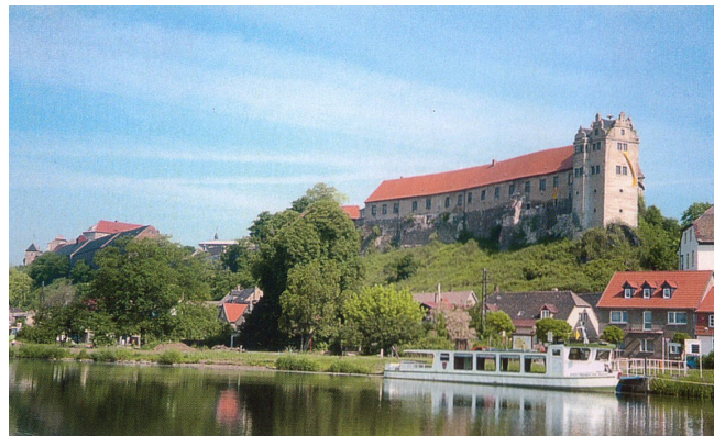
Stammburg Wettin an der Saale

Das Haus Wettin ist nach den Welfen das älteste urkundlich nachgewiesene Geschlecht des deutschen Adels, dem eine besondere Bedeutung für die Landesgeschichte heutiger deutscher Länder wie Sachsen, Thüringen, Sachsen-Anhalt u. Bayern mit Coburg zukommt.